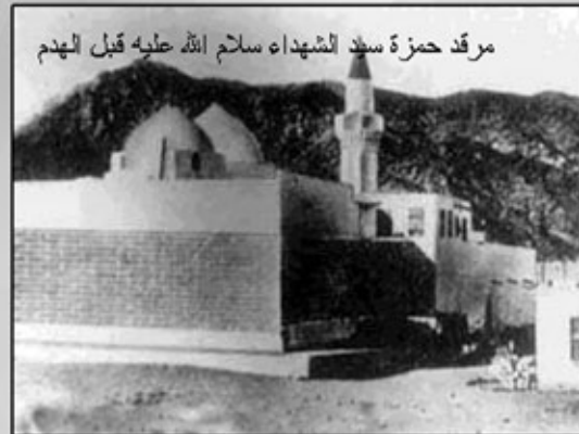
مرقد حمزة سيد الشهداء سلام الله عليه قبل الهدم

وما أن سمع الأنصار حتى جاؤوا بيوتهم وطلبوا من نسائهم الذهاب إلى بيت عم النبي (صلى الله عليه وآله وسلم) والبكاء عليه ثم أتوا لبيكوا على شهدائهم، فسر النبي (صلى الله عليه وآله وسلم) لذلك أصبحت سنة عند الأنصار إذ كلما أصابتهم مصيبة كان المسلمون يبكون على حمزة قبل أن يبكون على مصابهم، وقد دفن (رضوان الله عليه) في جبل أحد.