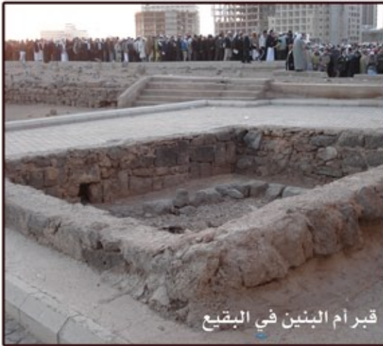
قبر أم البنين في البقيع

ولكن في الثامن من شوال كشر الوهابيون عن أنيابهم السامة وراحوا ينفثون حقدهم وكراهيتهم وفرضوا على أبناء بنائي المدينة جميعاً الاشتراك في الهدم ليتحمل الكل وزر ما اقترفته أيديهم القدرة.