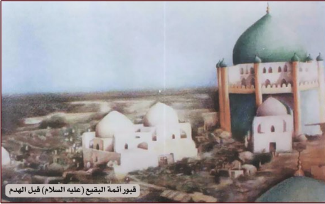
قبور أئمة البقيع (عليه السلام) قبل الهدم

البقيع عُرف أنه مقبرة المدينة المنورة في العهد النبوي الشريف، بعد أن دُفن فيه جمع كثير من الصحابة والشخصيات المعروفة منهم: أم النبي (صلى الله عليه وآله)، وعم النبي