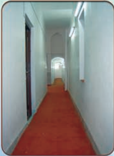
إعمار الطابق العلوي