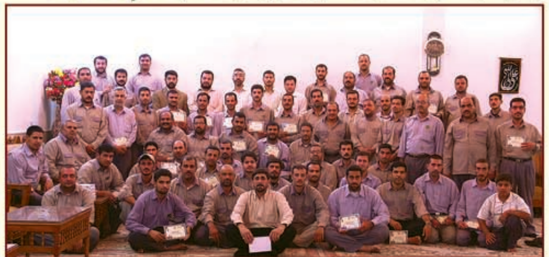
أقامة دورات دينية لخدم العتبة المقدسة ولأبنائهم