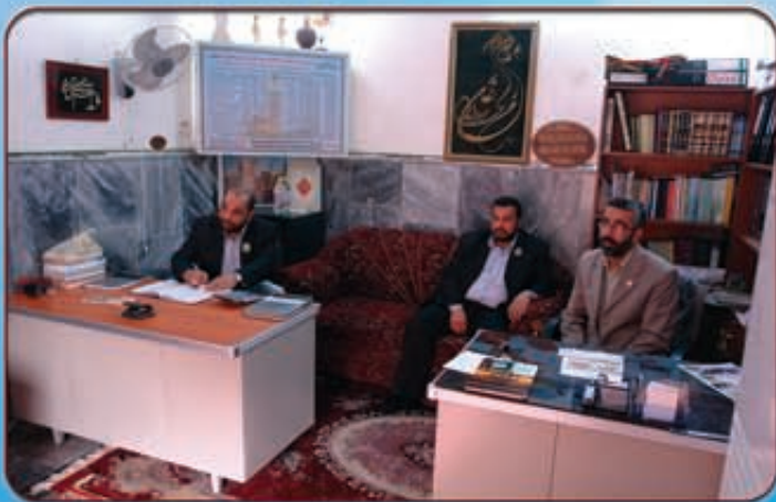
لقاء مع رئيس قسم الشؤون الدينية