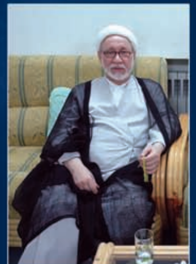
في ضيافة د الشيخ باقر المقدسي