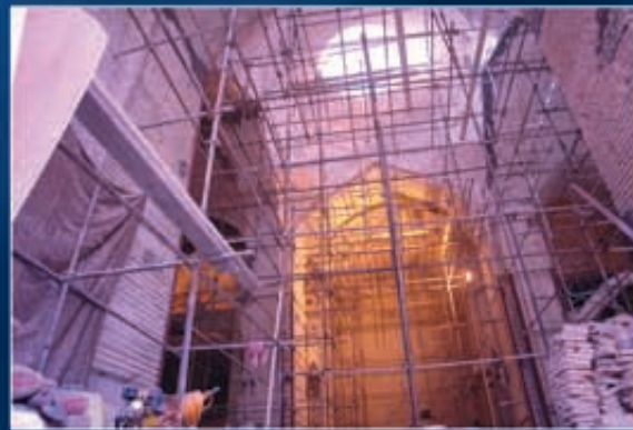
مشروع اعمار مسجد عمران بن شاهين