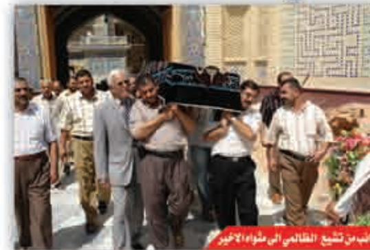
تقي الحكيم من تشيع الظالمي إلى طهارة الأخير