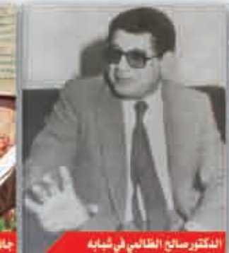
الدكتور صالح الظالمى في شبابه