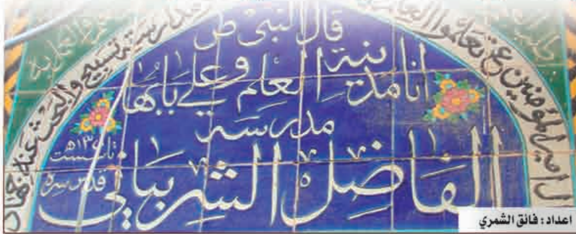
اعداد: فائق الشمري

تعد مدرسة الفاضل الشرياني من أشهر المدارس الدينية التي حظيت بشهرة واسعة ولا تزال قائمة الى يومنا هذا بما قدمته من خدمات جليلة للعلم والعلماء وعلى مدى اكثر من (١٠٠) عام .. أسسها الشيخ محمد المعروف بالفاضل الشرياني المتوفى سنة ١٢٢٤ هـ ١٩٠٤م وهو من مشاهير علماء النجف الاشرف أختط مدرسته قبل وفاته بأربع سنين، ولا تزال قائمة يسكنها بعض أهل العلم ..