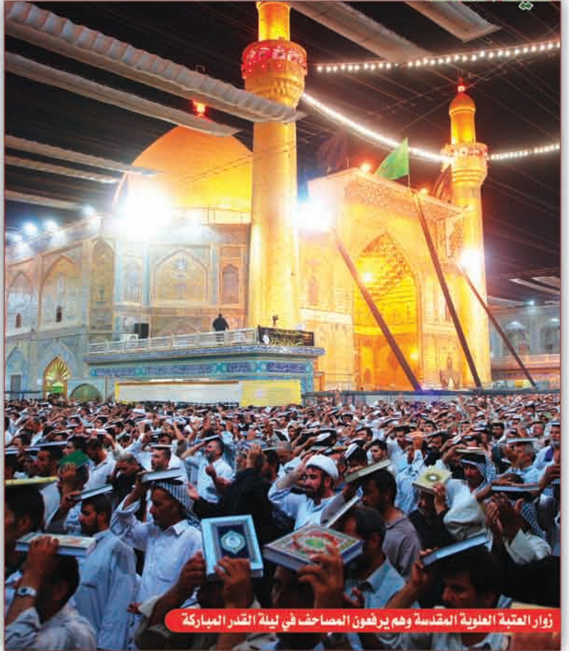
زوار العتبة العلوية المقدسة وهم يرفعون المصاحف في ليلة القدر المباركة

كل عمل تتمه بإتقان ونجاح تشعر بسعادة روحية تغمرك، فكيف تكون فرحتك كبيرة وسرورك عظيماً حينما يكون العمل المنجز هو واجب شرعي فرضه عليك الباري جل وعلا... قد لا توصف فرحتك وسعادتك، فنتهيأ لها بكل ما يشعرك بانتهاء العمل المضني الذي يرضي الله تعالى بالنجاح والتوفيق للاحتفاء به من ملابس وهدايا، وطقوس الفرحة الإسلامية، كل ما يلزم ليسعد الجميع صغاراً وشباباً وشيوخاً، ونساءً ورجالاً، فقيراً وغنياً.. هكذا أراد الله سبحانه أن تغمر السعادة الجميع ويعم الفرحة على الناس، بعد أن انتهى شهر رمضان شهر الطاعة الواجبة وشهر تفتحت فيه أبواب الرحمة للعاملين وأغلقت أبواب الجحيم. لقد أغدق الباري عز وجل من فيحاء جوده ونعمه ما يكافئ به الصائمين الخاشعين المرتلين للكتاب العزيز العاملين بأوامره ونواهيته، فكان العيد مكافأة لهم على صيامهم وطاقاتهم.. في العيد يشعر المسلمون بأنهم سواسية أمام الله، فيصطفون صفواً صفاً في صلاة العيد، وبعد الانتهاء من الصلاة تتصافح القلوب قبل الأيدي، وتتعايق النفوس قبل الأبدان مهنيئين بعضهم بعضاً، وشاكرين فضل ربهم على نعمائه وآلائه، فتقوى أوامر الأخوة والمحبة بينهم مما يجعلهم كالبنيان المرصوص يشد بعضهم بعضاً.