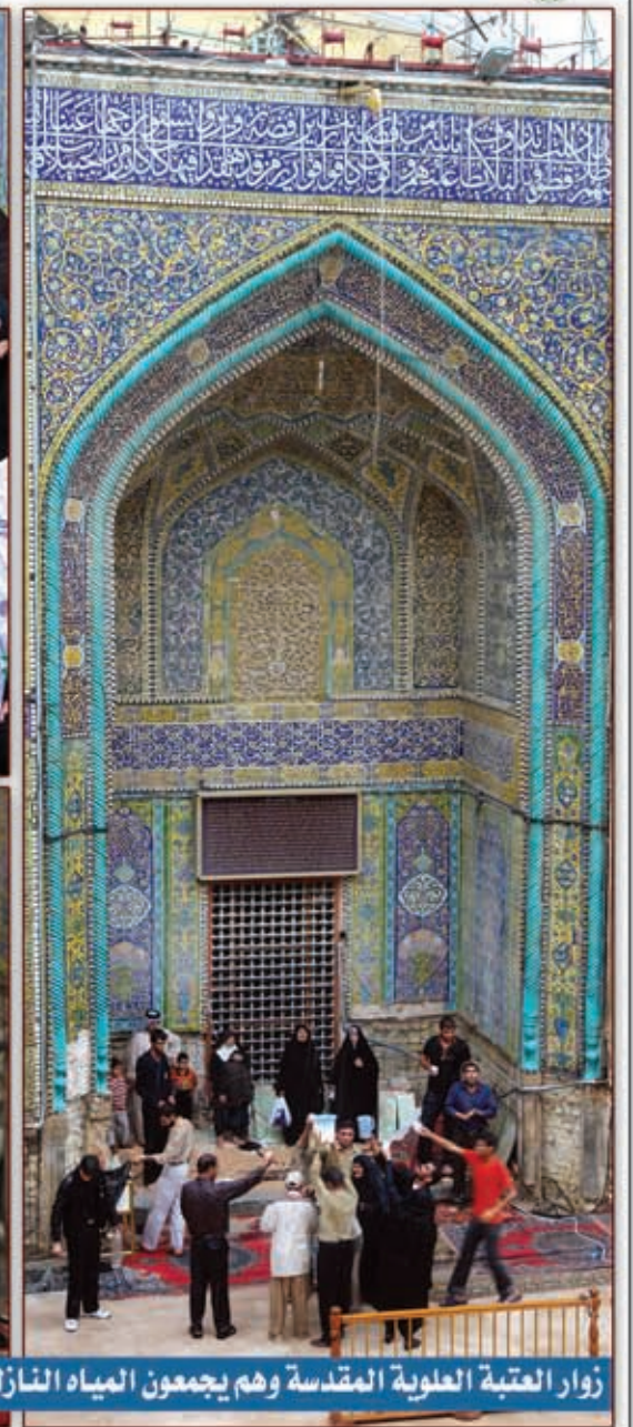
زوار العتبة العلوية المقدسة وهم يجمعون المياه النازلة من ميزاب الذهب للتبرك أثناء هطول الامطار