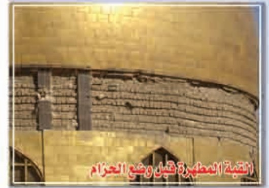
القبة المطهرة قبل وضع الحزام

أولاً: الأضرار التي سببتها تأثيرات العوامل البيئية على القطع النحاسية، حيث أن النحاس كما هو معروف هو من المعادن التي تتأثر بالغازات الطبيعية مثل (ثاني أكسيد الكبريت وغازات الكبريت الناتجة عن حرق المشتقات النفطية) ويتآكل تحت تأثير الرطوبة. الدراسات المنجزة على الكتيبة بيّنت أن الصفائح النحاسية لم تتأثر كثيراً بالمؤثرات البيئية وذلك بسبب سمكها