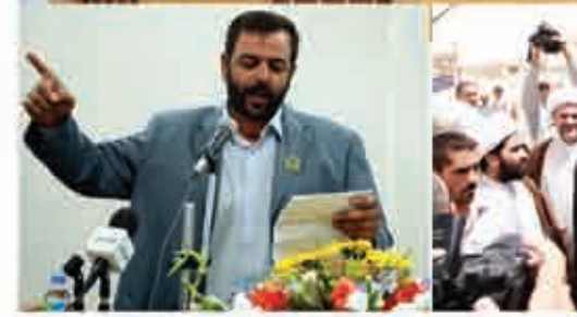
فرحا بهذه المناسبة الميمونة. واختتم الحفل الكريم بهذه الايات:

دَجَى الظلام انجلت وانماحت السترُ وأصبح الحق فارحل أيها الكنرُ اليوم عادت لأهل الحق بهجتهم من بعد كاد يزيل النعمة الأشرُ هنا عليّ وقد عادت لقيته من سورة الفتح أي ذكرها عطرُ تعانق اليوم قرآنان واشتباك المرتضى الطاهر الكرار والسورُ