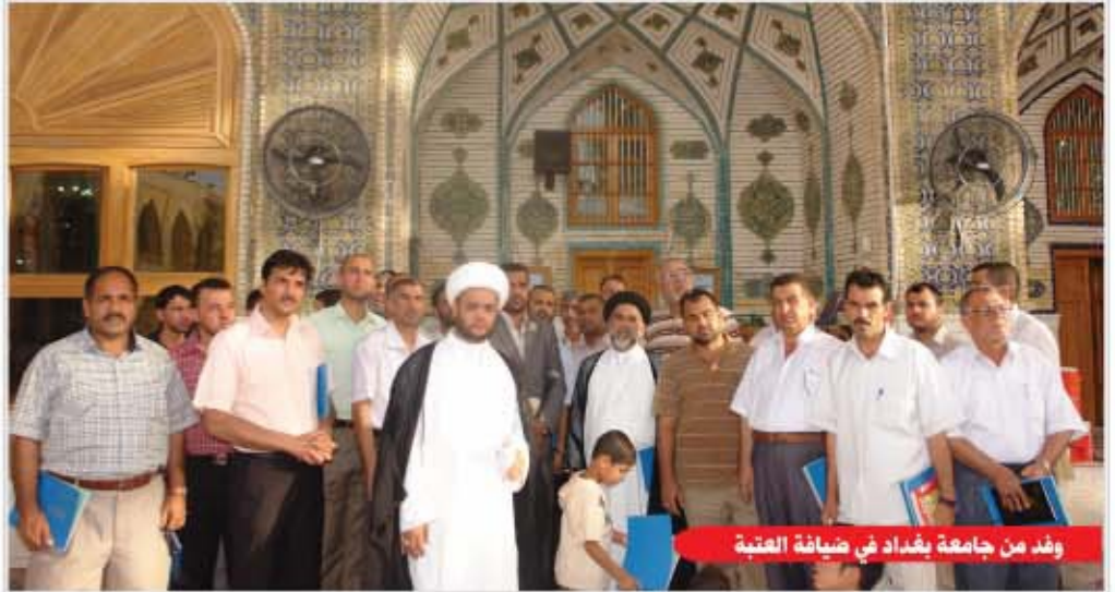
وفد من جامعة بغداد في ضيافة العتبة