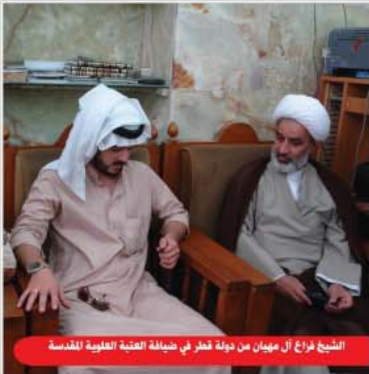
الشيخ فراع آل مهيبان من دولة قطر في ضيافة العتبة العلوية المقدسة