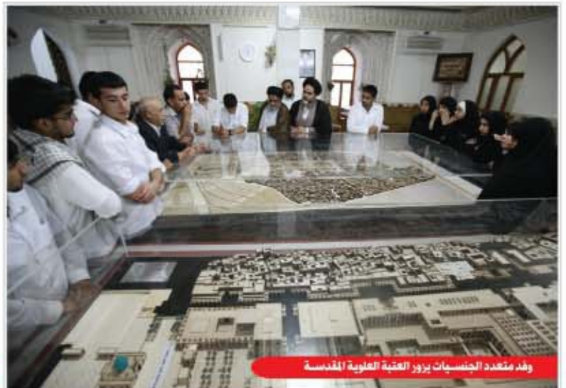
وفد متعدد الجنسيات يزور العتبة العلوية المقدسة