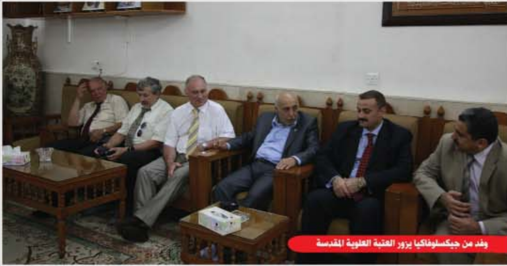
وفد من جيكلوفاكيا يزور العتبة العلوية المقدسة