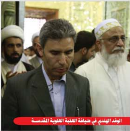
الوفد الهندي في ضيافة العتبة العلوية المقدسة