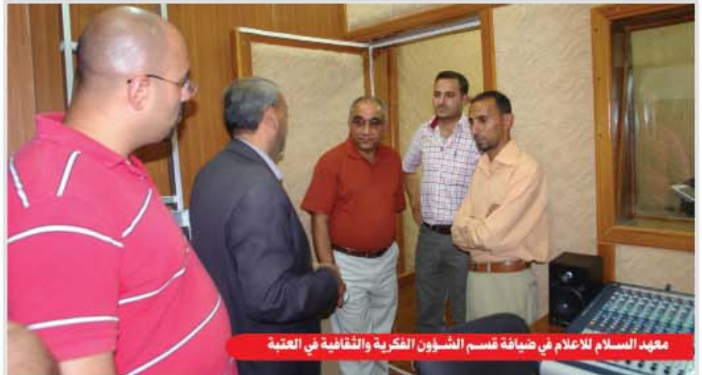
معهد السلام للاعلام في ضيافة قسم الشؤون الفكرية والثقافية في العتبة