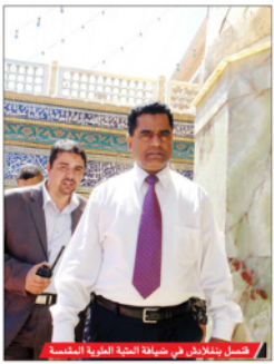
فصل بنشلاش في ضيافة العتبة العلوية المقدسة