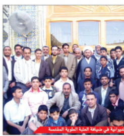
مؤسسة النجم النورية في الضيافة في الضيافة العلوية المقدسة