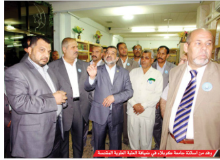
وفد من اسكتلدا جامعة كمبرلاند في ضيافة العتبة العلوية المقدسة