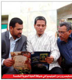
مستشرقون من تونس في ضيافة العتبة العلوية المقدسة