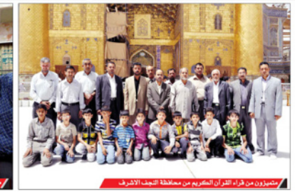
متميزون من قرآن الكريم من محافظة التجف الأشرف