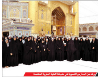
وفد من منتسبي الهيئة الطلابية المقدسة في ضيافة العتبة العلوية المقدسة