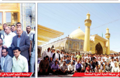
في ضيافة العتبة العلوية المقدسة