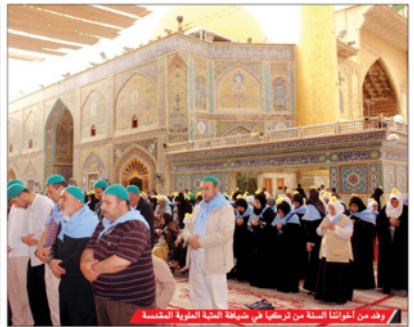
وفد من أحوالنا السنة من تركيا في ضيافة العتبة العلوية المقدسة