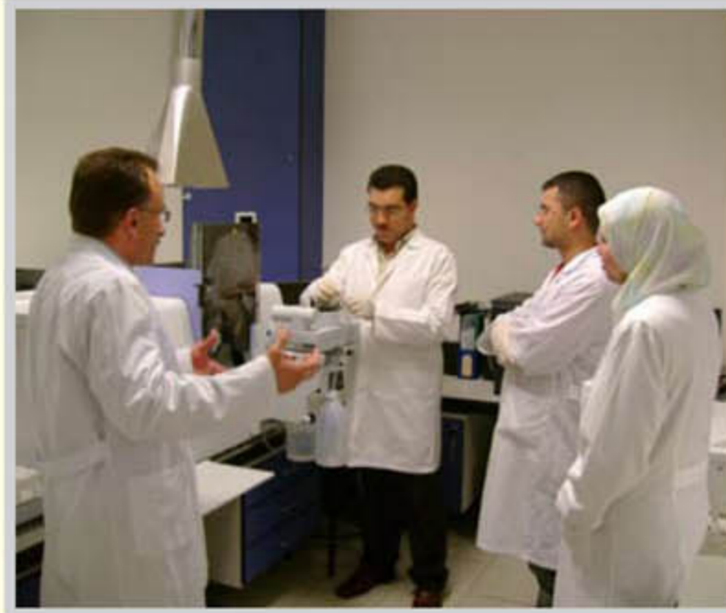
المرأة من الإختلاط المحرم

لقد وضع الشارع المقدس ضمانات لتحسين المرأة - حين تخرج من بيتها الأبوي والزوجي - من الإختلاط المحرم. وهذه الضمانات منها ما يشمل الرجال والنساء، ومنها ما يختص بالنساء، ومنها ما يختص بالرجال. وهذه الأمور - الضمانات التي سنذكرها ليست خاصة بالمرأة العاملة أو المرأة في مجال العمل، بل إن ما كان منها خاصاً بالمرأة هو أحكام للمرأة مطلقاً عندما تتصل بالمجتمع خارج الأسرة، وما كان منها عاماً للرجل والمرأة هو ثابت عليهما مطلقاً عندما يلتقيان في أي مجال من